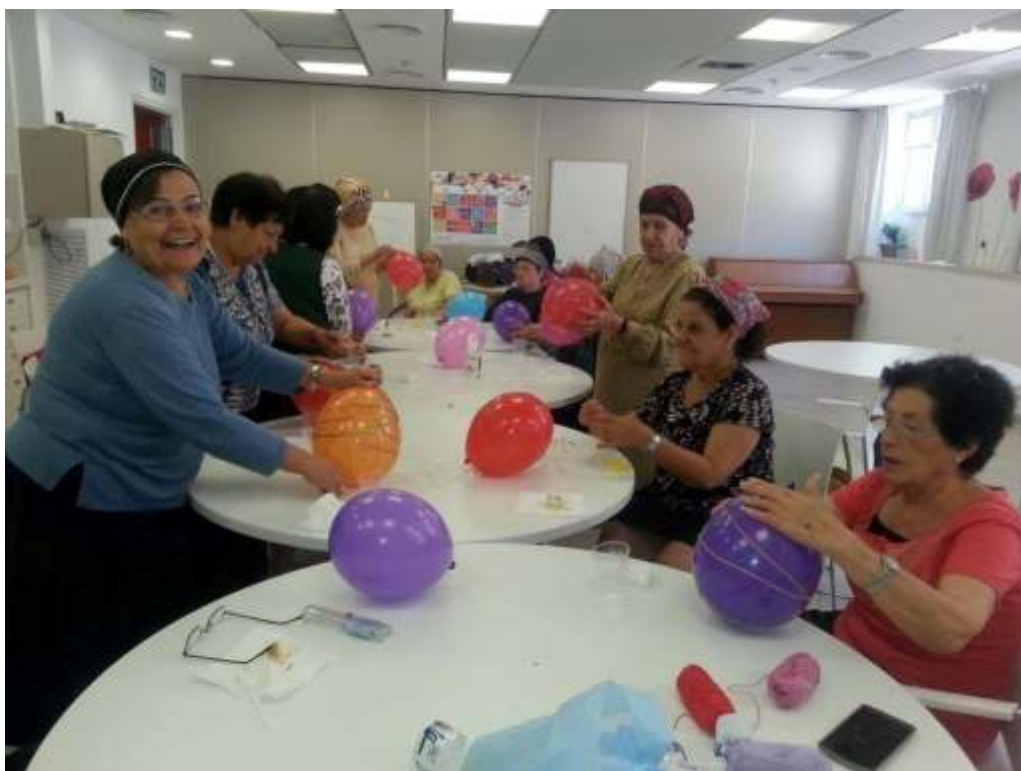
פעילות 50 פלוס במוסררה.

החודש ייפתח פופ אפ בר בגינה הקהילתית, מרכז צעירים עבור בני 50 פלוס כבר נפתח ובתחילת החודש תיערך הצגה "היה יהיה" על פערים בין הדורות. הכניסה חופשית לכל הפעילויות