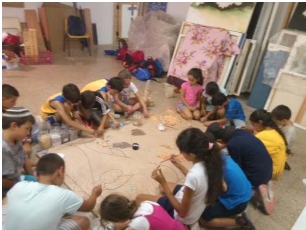
פעילות לילדים במוסררה.

עבור בני 18+ הנמצאים אף הם בחופשות לפני הגיוס הקרב ובא, יפתח בתחילת אוגוסט פופ אפ בר בגינה הקהילתית. כמו כן, נפתח מרכז מיוחד הצעיר בגילו וברוחו לבני 50+ וכולל אירועים, סדנאות, הרצאות ועוד.