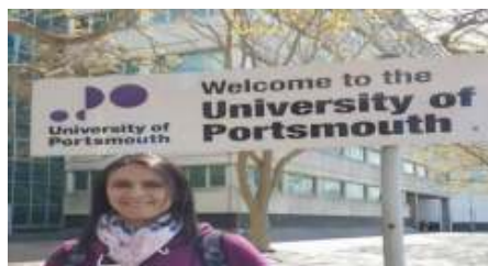
فلسطينية تفوز بجائزة أفضل بحث بالمؤتمر الدولي للمدن الذكية